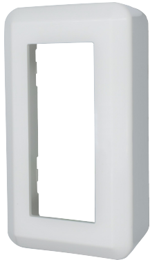
カバー(上下反転可能)