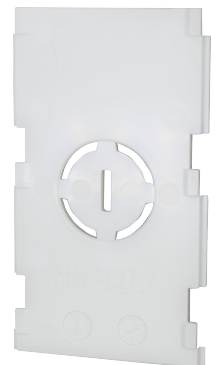
裏蓋(中央部分は穴開け可能)